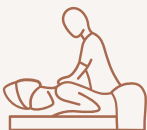
CABINES DE SOINS